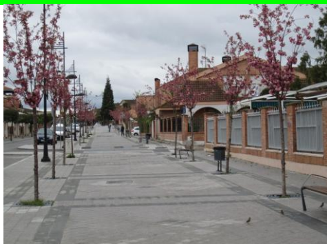
Avenida de la Nava

Verás que todos los programas electorales incluyen algunas inversiones y servicios de los que dispondrás en los próximos meses o años porque ya están contratados o están construyéndose , algunos más tarde de lo deseable por efecto de una crisis económica en la que otros nos han metido.